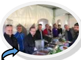
Guests enjoying a delicious meal / Les invités apprécient un délicieux repas

« Lors d'une visite guidée du Centre, j'ai compris l'ampleur des services offerts et les besoins à combler dans la communauté. Cette visite m'a incitée à devenir un commanditaire d'événement pour appuyer le Centre. » ~ Commanditaire de événement 2017